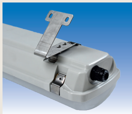
Set Metallwinkel 45° für Wandaufnahme (2 Stk.) EXV006