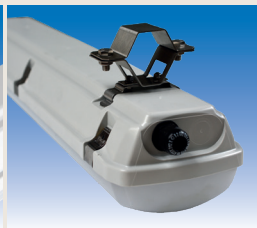
Schelle für die Be- festigung auf einem Ausleger mit Ø 50 mm EXV008

– weitere Ausführungen auf Anfrage / Änderungen und Irrtum vorbehalten –