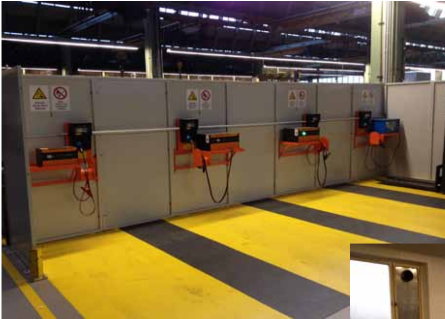
Batterieladeanlagen für elektrische Flurförderfahrzeuge der Firma PIV, umgesetzt mit ELSPRO Vollgummiverteilern Baureihe REMSCHEID