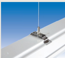
selbstsperrende Sei- laufhängung (2 Stk. à 3 m) EXV007