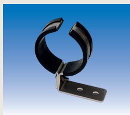
Montageschellen Edelstahl (2 Stk.)