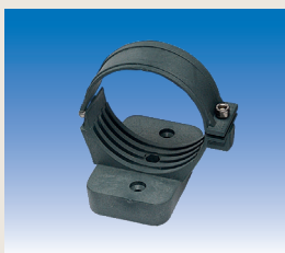
Montageschellen Kunststoff dunkelgrau (2 Stk.)