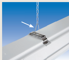
Drahtbügelset (2 Stk.) für Kettenaufhängung (ohne Kette) EXV005/SET