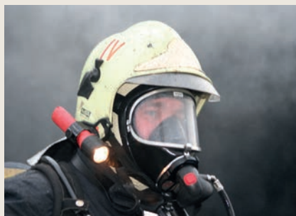
Helmhalter LX-68086 montiert