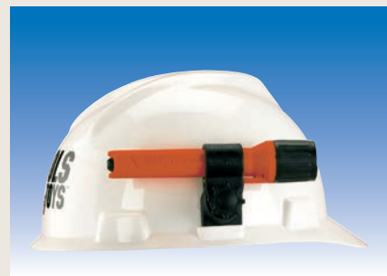
Helmhalter LX-68089 montiert

– weitere Ausführungen auf Anfrage / Änderungen und Irrtum vorbehalten –