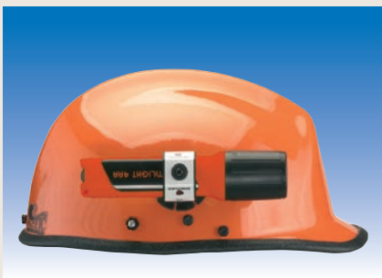
Helmhalter LX-68271 montiert