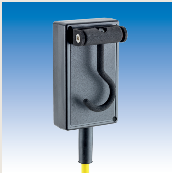
Der um 360° drehbare Haken lässt sich auf der Gehäuserückseite wegklappen.