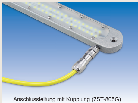
Anschlussleitung mit Kupplung (7ST-805G)