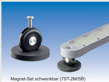
Magnet-Set schwenkbar (7ST-2M/SB)