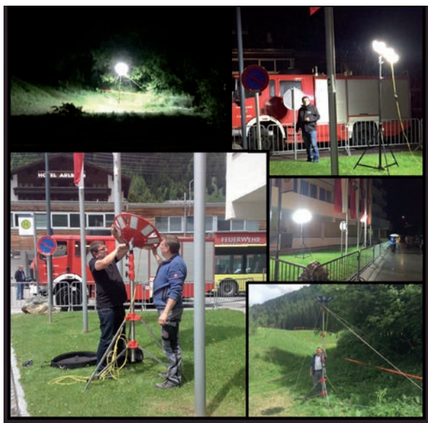
Schon beim Aufbau erweckt die ELSPRO N8LED Interesse

In St. Anton am Arlberg fand vom 03. bis zum 04. Juni 2016 der 54. Landesfeuerwehrleistungsbewerb in Bronze und Silber statt. Damit das Areal auch in den problematischen Bereichen im richtigen Licht erscheinen konnte, war auch die ELSPRO Elektrotechnik vor Ort.