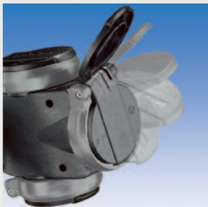
mit selbstschließenden Klappdeckeln