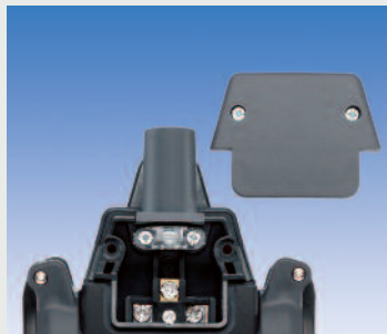
mit separatem Anschlussraum