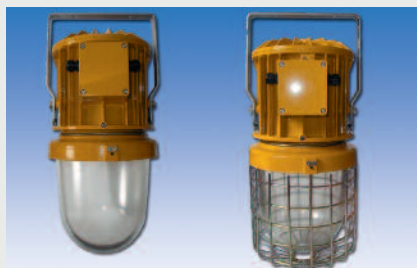
Ausführung mit Schutzkorb (K)