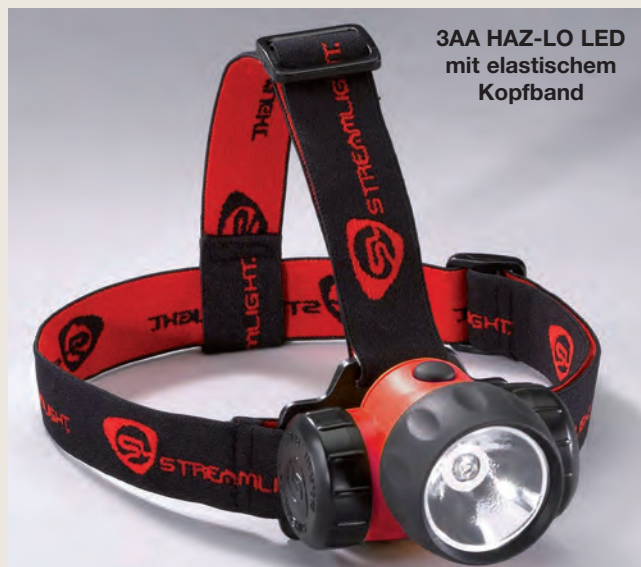
3AA HAZ-LO LED mit elastischem Kopfband

Die Leuchtdauer pro Set Batterien beträgt ca. 11 Stunden. Danach reduziert sich die Lichtausbeute auf 25% der normalen Leistung (34 Lumen).