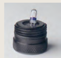
Ersatzleuchtmittel in Verschlusskappe (Xenonmodell)