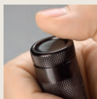
Drücken auf Endkappe für Momentanbetrieb