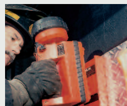
sicheres Anbringen durch Wandhalterung