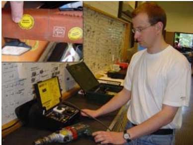
Bild 9) Prüfung ortsveränderlicher elektrischer Arbeitsmittel, Dokumentation der Prüfergebnisse durch Prüfplakette

Zur Kennzeichnung und Dokumentation können auch Prüfplaketten und elektronische Aufzeichnungssysteme genutzt werden. Hier wird empfohlen, die Arbeitsschutz relevanten Messwerte messtechnisch zu ermitteln und im Rahmen eines angepassten Prüfmanagements aufzuzeichnen.