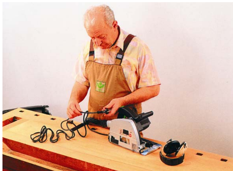
Bild 1: Funktions- und Sichtprüfung durch unterwiesene Personen – Inaugenscheinnahme vor der Arbeitsmittel-Benutzung.

Durch die konkretisierende Ergänzung im Vorschriftentext der UVV: „...auf ihren ordnungsgemäßen Zustand geprüft werden“ geht die Schutzzielbeschreibung der UVV bewusst über die üblichen sicherheitsrelevanten Arbeitsschutzregelungen hinaus (vgl. § 5 UVV/BGV A3), um die Besonderheiten beim Einsatz elektrotechnischer Betriebsmittel (Arbeitsmittel) praxisbezogen zu berücksichtigen. Diese Besonderheiten ergeben sich durch unterschiedliche Einsatz- und Umgebungsbedingungen beim Betrieb elektrischer Arbeitsmittel; z. B. auf Bau- und Montagestellen, in engen leitfähigen Bereichen, bei der Bühnen- und Veranstaltungstechnik.