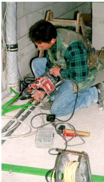
Bild 6): Einsatz handgeführter elektrischer Arbeitsmittel auf Bau- und Montagestellen (hier: Staubbeanspruchung, ausreichende mechanische Festigkeit der handgeführten elektrischen Betriebsmittel, fehlende Zusatzisolierung des Leitungsrollers)