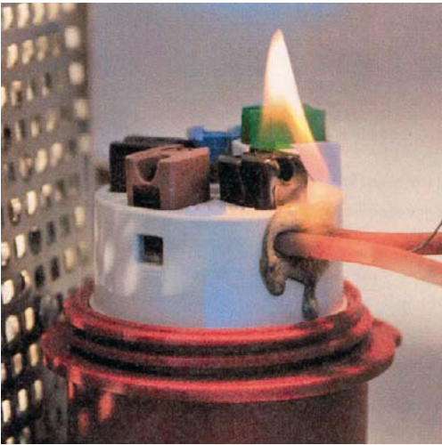
Bild 2: Labortechnische Untersuchung; Glühdrahtprüfung an einer CEE-Steckvorrichtung

Bei der Ordnungsprüfung wird insbesondere festgestellt, ob