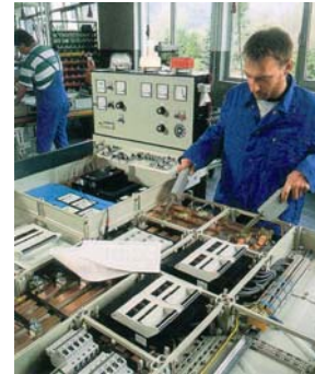
Bild 5: Montage einer Niederspannungsverteilungsanlage; Prüfung nach der Errichtung und vor Inbetriebnahme der Verteileranlage mit Dokumentation der Messergebnisse.