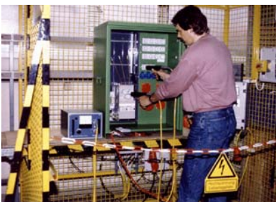
Bild 8) Abschlussprüfung an einem Baustromverteiler – elektrisches Arbeitsmittel zur Versorung von Bau- und Montagestellen