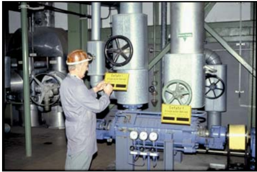
Bild 4: Vorbeugende Instandsetzung zur Sicherstellung der Betriebssicherheit; Pumpstation mit der Notwendigkeit einer störungsarmen elektrischen Energieversorgung.